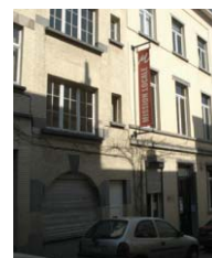
Mloc de St-Josse