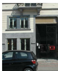
Mloc de Molenbeek