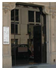
Mloc de BXL-Ville