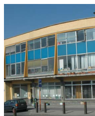
Mloc de Forest