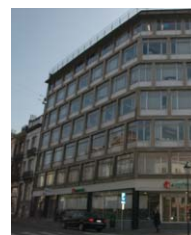
Mloc de St Gilles