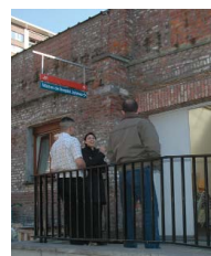
Mloc de Schaerbeek